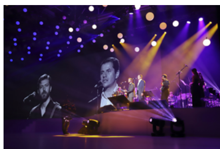
Für die musikalische Unterhaltung bei der Eröffnungsfeier sorgten das Baltic Sea Philharmonic Ensemble unter der Leitung von Kristjan Järvi, der live aus Shanghai dirigierte, die Band „3-Satz deluxe und Friends“ und die Shantychöre „Breitlings“ und „The Blowboys“.