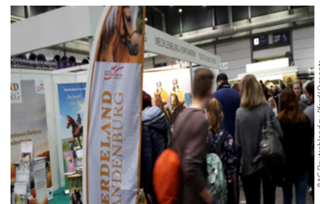
Impressionen des Gemeinschaftsstandes mit Brandenburg und der Bundesarbeitsgemeinschaft Deutschland zu Pferd anlässlich der Partner Pferd 2018 in Leipzig