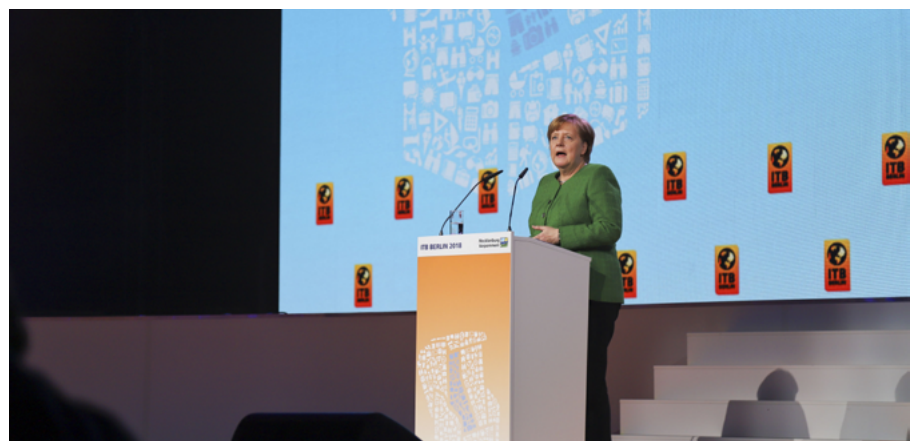
Bundeskanzlerin, Dr. Angela Merkel, betonte in ihrer Eröffnungsrede die Bedeutung des Tourismus für Deutschland.