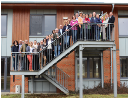
Unter dem Dach der Bundesarbeitsgemeinschaft Deutschland zu Pferd fand die 4. nationale Pferdetourismuskonferenz in Luhmühlen statt und warb für Deutschland als attraktives Reiseziel für Pferdefreunde mit seinen vielfältigen

Auf der gemeinsam von der Bundesarbeitsgemeinschaft Deutschland zu Pferd e.V. und der IHKN organisierten 4. Nationalen Pferdetourismuskonferenz am 13. und 14.03.2018 in Luhmühlen diskutierten die Fachexperten von der Ostsee bis zum Bodensee, vom Rhein bis zur Oder über die Neuerungen im EU-Pauschalreiserecht mit ihren weitreichenden Auswirkungen gerade auch für die Tourismusdestinationen und -organisationen, dem Ausbau des Marketings und Wege zur Verbesserung der Qualität.