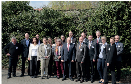
Gründungsmitglieder der Bundesarbeitsgemeinschaft Deutschland zu Pferd

Die Bundesarbeitsgemeinschaft Deutschland zu Pferd möchte eine Kommunikations- und Kooperationsplattform für die pferdetouristischen Anbietergemeinschaften in ganz Deutschland werden und damit die Netzwerkbildung vorantreiben. Denn letztlich sind alle Regionen mit denselben Themen konfrontiert: Reitwegeausweisung und -pflege, Pferdesteuer, Qualität der Anbieterbetriebe und Qualifizierung der Unternehmer, betriebswirtschaftliche Steuerung, Preiskalkulation, Marketing, Vertrieb, Umgang mit dem immer anspruchsvoller werdenden Gast usw. Ziele sind daher ein Meinungs- und Erfahrungsaustausch, aber auch gemeinsame Aktivitäten.