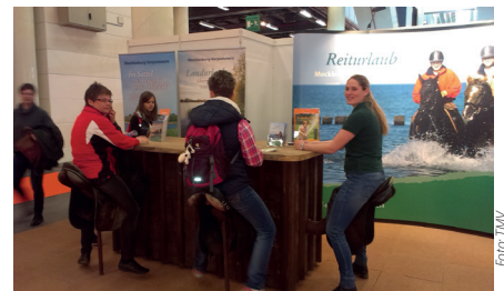
Impressionen des Messestandes auf der HansePferd vom 22. bis 24. April 2016 in Hamburg