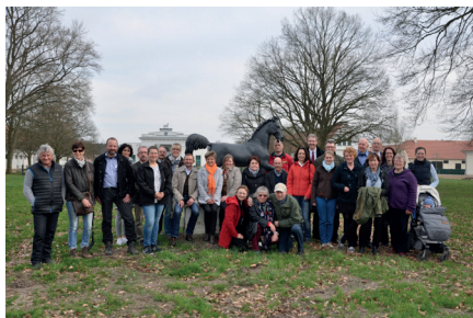
Teilnehmer der 2. Nationalen Pferdetourismuskonferenz

Als Kernziel der Aktivitäten will sie die Attraktivität des Pferdlandes Deutschland mit all den wunderbaren Angeboten im In- und Ausland bekannter machen. Denn die Reisedauer der Urlauber wird immer kürzer, (verlängerte) Wochenenden und Kurzreisen gewinnen an Bedeutung, damit wachsen die Chancen für inländische Reiseziele. Zudem steigt die internationale Nachfrage überproportional an. Anlässlich der Konferenz ist daher ein Prototyp eines gemeinsamen deutschlandweiten Webauftritts, von der aus die Interessenten in die einzelnen Pferdetourismusregionen und zu den Anbietern weitergeleitet werden, vorgestellt worden. Darüber hinaus werden gemeinsame Messeauftritte und weitere gemeinsame Marketingaktivitäten stattfinden, die den Pferdefreunden die Vielfalt des Marktes leichter sichtbar und buchbar machen als das bisher der Fall ist.