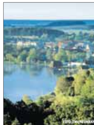
Blick auf den Krakower See

In allen Regionen Mecklenburg-Vorpommerns laden Seen in der warmen Jahreszeit zum Baden ein. Der Neustädter See in Mecklenburg-Schwerin eignet sich durch seine ausgezeichnete Wasserqualität und seinen sandigen Untergrund hervorragend zum Planschen, Spielen und Schwimmen für Klein und Groß. Mit seiner Größe von 146 Hektar lädt er ebenso zum Segeln, Rudern oder Angeln ein. Wer vor der Abkühlung noch den See umwandern möchte, ist am Pulower See in Vorpommern genau richtig. Naturbadestellen laden zum Erfrischen ein. In dem angrenzenden Örtchen Pulow sorgt ein kleines Café für das leibliche Wohl. Der Krakower See in der Mecklenburgischen Seenplatte erhält bereits seit 1998 die Blaue Flagge für seine hervorragende Wasserqualität. Der herrlich gelegene Insel- und buchtenreiche See bietet