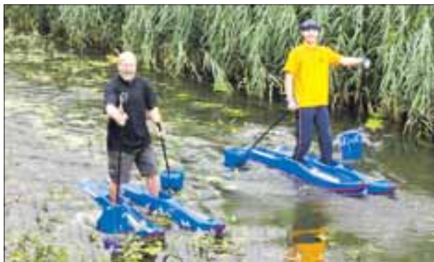
Mit den Mecklenburger Schwimmschuhen übers Wasser laufen.