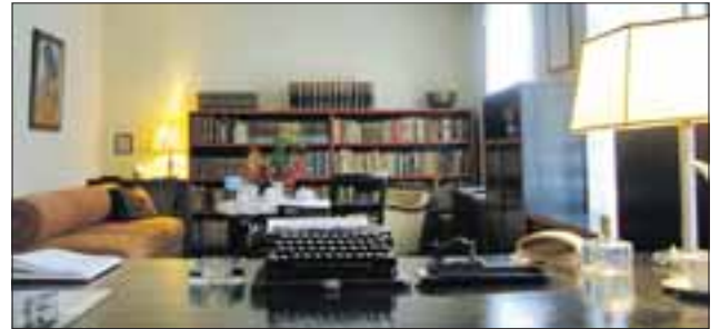
Das Arbeitszimmer von Hans Fallada.

Das Museum gibt zahlreiche Einblicke in Falladas Leben. In seinem Arbeitszimmer können Besucher originale Exponate bestaunen. Im nahezu original-