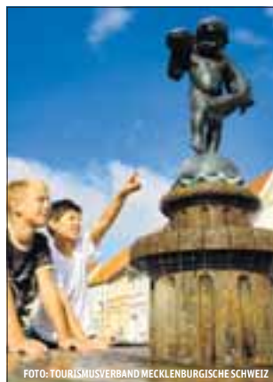
Der Hechtbrunnen auf dem Markt in Teterow.

Die 48 Kilometer lange Radtour entlang der von einem kleinen Höhenzug eingeschlossenen Ebene inmitten der Mecklenburgischen Schweiz hält viele Gelegenheiten zum Schmunzeln, Staunen und Entspannen bereit. Schon bei der Rundfahrt durch die mittelalterliche Kleinstadt Teterow stellt sich oft gute Laune ein. Der Hechtbrunnen auf dem Marktplatz erinnert schließlich an einen amüsanten Schildbürgerstreich. Angler sollen einen gefangenen Fisch mit einer Glocke versehen und ihn wieder ins Wasser gelassen