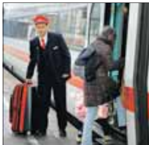
Wer Hilfe braucht, bekommt sie von den Servicemitarbeitern

*) 14 ct./Min., aus dem Festnetz, Tarif bei Mobilfunk 42 ct./Min.)