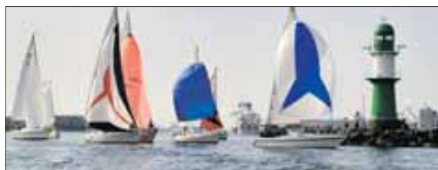
Die Warnemünder Woche

Karten und Informationen: www.auf-nach-mv.de/events