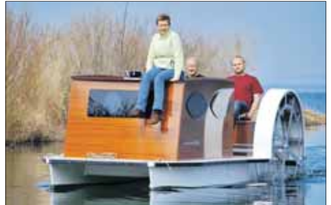
Das Tretboot „Lütt Hütt“ mit Schaufelradantrieb.

In Gneven können Urlauber mit den Mecklenburger Schwimmschuhen, acht Kilogramm schweren und wie kleine Kanus aussehende Plastikschuhe, förmlich übers Wasser gehen. Mit Hilfe von Stöcken schieben sie sich über die Wasseroberfläche. In der Mecklenburgischen Seenplatte dagegen lernt der Wohnwagen schwimmen. Die hier eingeführten „freecamper“ lassen den eigenen Wohnwagen zum Hausboot werden. Ein motorisiertes Floß wird dabei zum fahrbaren Wohnwagen-Stellplatz und eröffnet den Campern ganz neue Perspektiven.